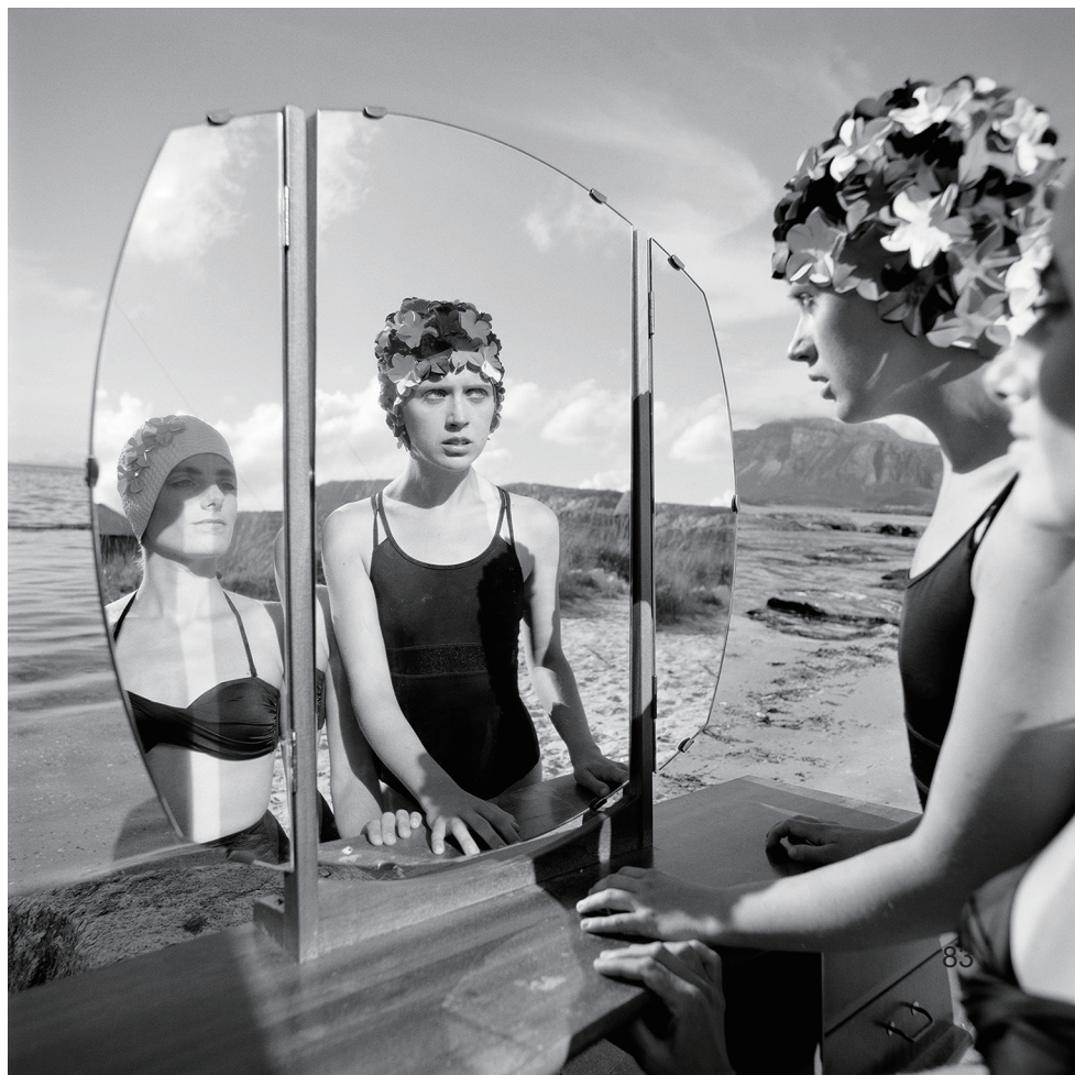
下图 /© YANG FUDONG, The Light That I Feel 8, 2014.