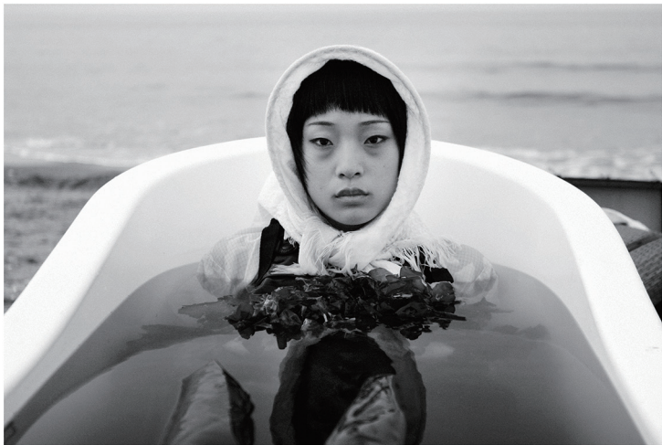
上图 /© YANG FUDONG, Seven Intellectuals in Bamboo Forest, Part IV, 2006.