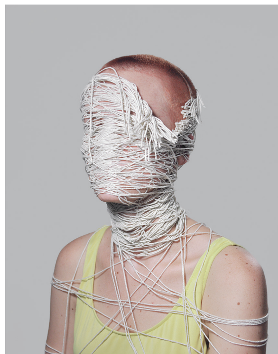
上图 /© CARLA LIESCHING, Study, 2015. Courtesy of Brownie Project (Shanghai)

因此，回归到 PHOTOFAIRS，传统的摄影艺术博览会仅仅面向摄影代理商及画廊，而现在，随着界限的模糊，影像的边界也随之拓宽。“PHOTOFAIRS 为这项工作提供量身定制的环境，以及寻找它的年轻、新的活力观众。” Scott 说到。■