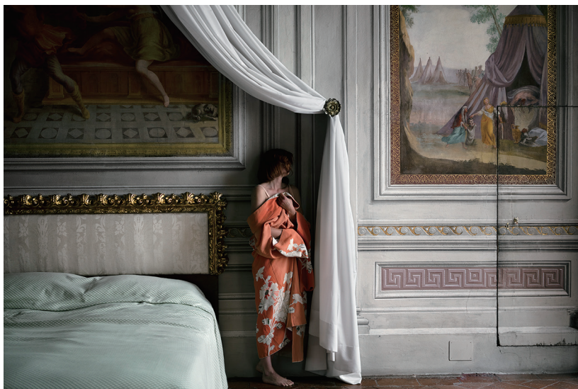
上图 /, The woman who never existed, The bedroom.