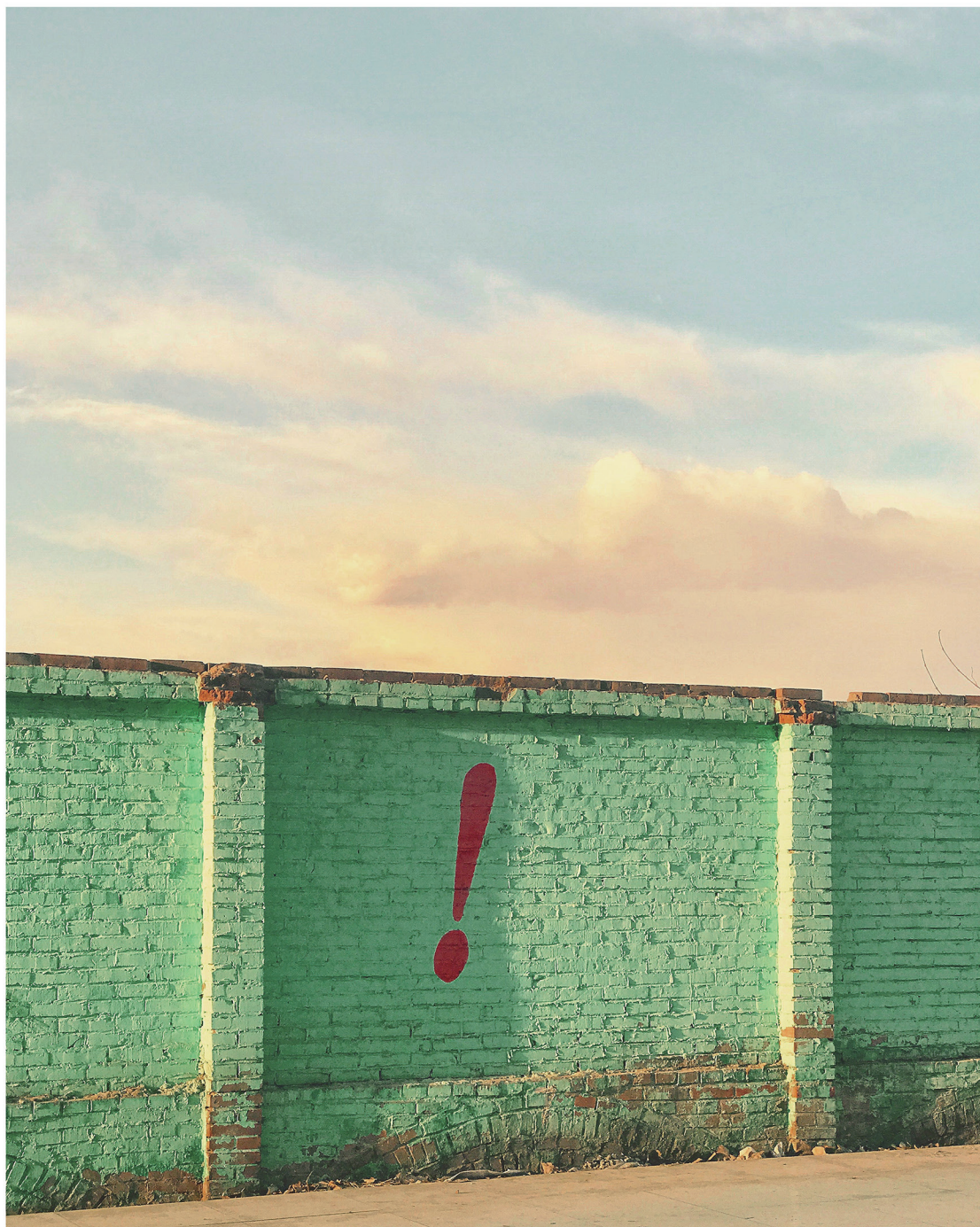
© YANG MAOYUAN, Shunyi, 2017. Courtesy of One Way Art Gallery (Beijing)